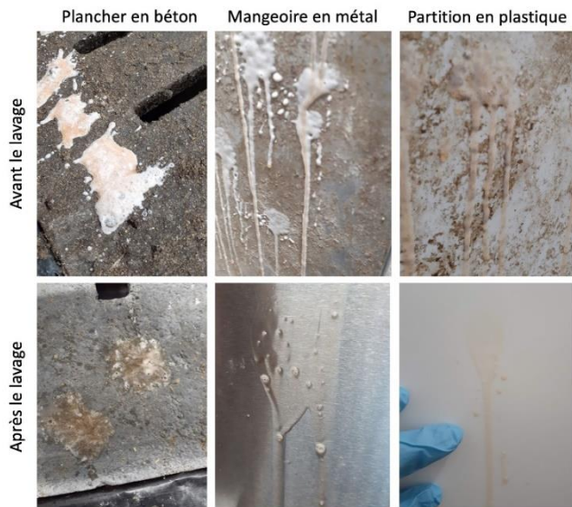
Figure 4. Test du BioFinder avant et après le processus de lavage

Il est important de souligner que ces méthodes d'analyse, bien que pratique, ne permettent pas une quantification précise des niveaux de contamination bactérienne. Elles peuvent néanmoins être utiles pour évaluer rapidement l'efficacité d'un lavage et pour surveiller les niveaux de salubrité.