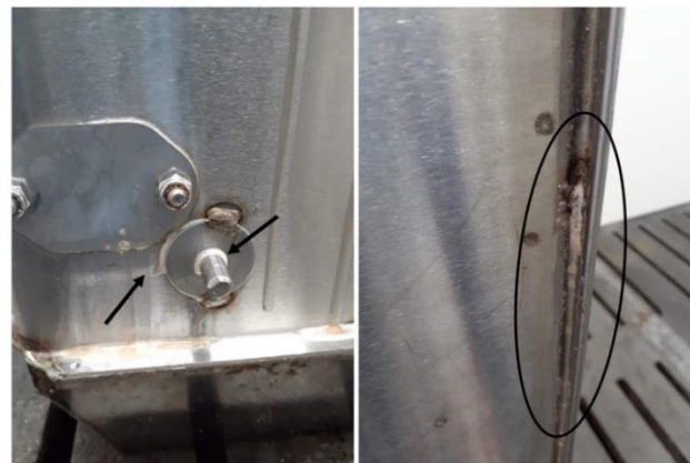
Figure 5. Illustration de la formation de bulles dans les coins après l'application de BioFinder