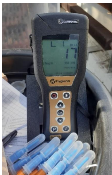
Figure 1. Luminomètre Hygiena EnSURE