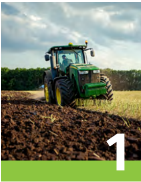
Entreprises maraîchères mécanisées