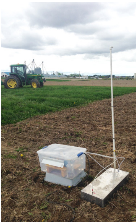
Figure 2. Chambre de volatilisation pour capter l'ammoniac

Les émissions d'ammoniac ont été mesurées après chaque épandage à l'aide d'une chambre de volatilisation disposée à la surface du sol ( figure 2 ). Dans cette chambre, un flux d'air constant entraînant l'ammoniac volatilisé a été bullé dans une solution d'acide sulfurique, permettant de doser l'ammonium au laboratoire et de calculer les émissions. Les échantillonnages ont été faits 4 heures, 24 heures, 96 heures, 7 jours et 10 jours après l'application de lisier.