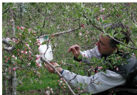
Figure 2. Dépistage de l'hoplotype des pommes à l'aide d'un piège collant.