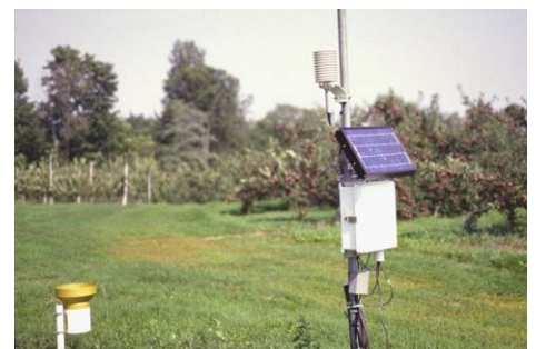
Figure 3. Station météo en verger.