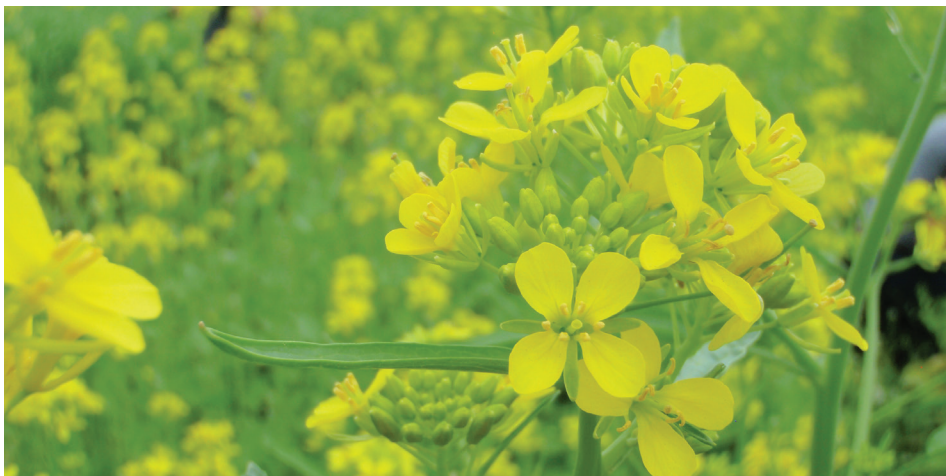
Fleurs de moutarde brune

Dans notre essai, la quantité d'ITCs a varié considérablement. Le potentiel biofumigant de la moutarde était très faible en 2014, où l'analyse chimique a révélé une production principale d'allyl-ITC et des traces de butyl-ITC, de butenyl-ITC, d'isopropyl-ITC et de butane 1-ITC (Tableau 1). Des fertilisations supplémentaires en soufre ont été effectuées en 2015 et 2016, ce qui a amélioré la quantité d'ITCs détectés. Les plants ont généré entre 1 155 et 2 299 µg d'allyl-ITC g -1 au printemps 2016. La moutarde n'a pas atteint le stade de pleine floraison à l'automne 2015, stade requis pour observer une quantité optimale d'ITCs. La biomasse de la moutarde brune variait de 2 046 à 5 587 kg ha -1 alors que celle de l'avoine était de 1 519 à 7 155 kg ha -1 . Les meilleures conditions de biofumigation réalisées dans notre essai ont été observées au site 1 en 2016 et au site 2 à l'automne 2016 alors que la biomasse de la culture était supérieure à 4 t ha -1 de matière sèche et que l'analyse chimique a détecté des taux supérieurs à 1 000 µg d'allyl-ITC g -1 ainsi qu'un taux de conversion supérieur à 2 %.