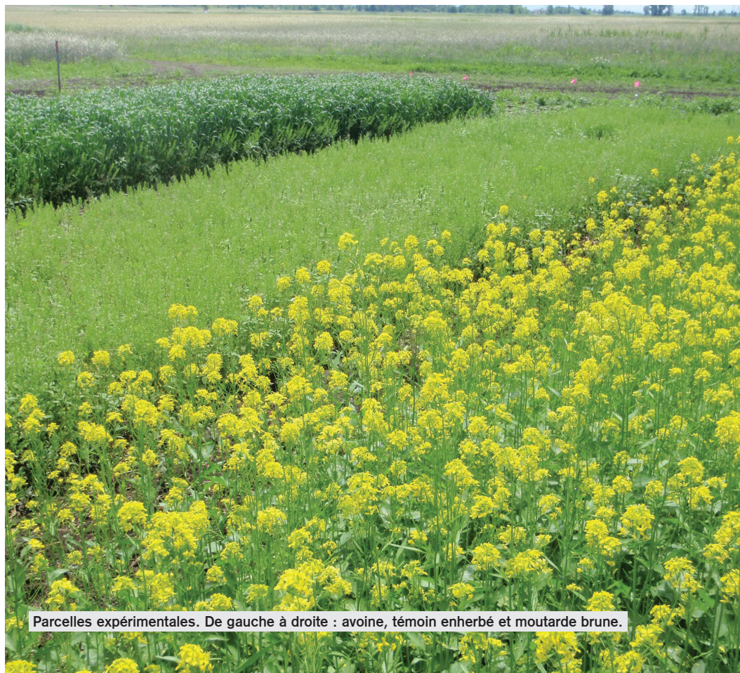
Parcelles expérimentales. De gauche à droite : avoine, témoin enherbé et moutarde brune.

Les premiers semis d'engrais verts ont eu lieu en 2014 et se sont répétés au même endroit en 2015 et en 2016. La biomasse des mauvaises herbes et des engrais verts a été évaluée avant l'incorporation de ceux-ci. Le dispositif expérimental était en bloc aléatoire complet avec quatre répétitions. Le potentiel biofumigant de la moutarde a été mesuré par une analyse en chromatographie en phase gazeuse et spectrométrie de masse, mesurant ainsi la quantité d'ITCs générée par la culture. Des sondes mesurant la quantité de volatiles gazeux dans le sol ont été utilisées pour mesurer les ITCs réellement relâchés dans le sol et ainsi pouvoir estimer leur taux de conversion efficace.