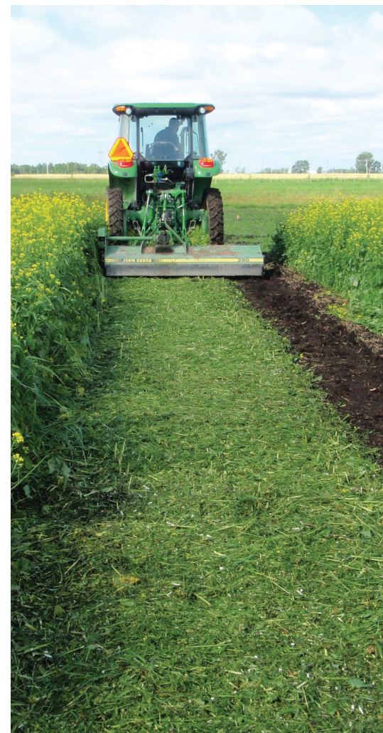
Fauchage des plants de moutarde en pleine floraison.