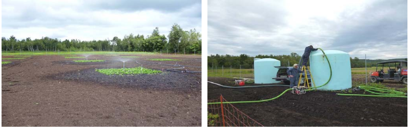
Figure 1. Irrigation des parcelles (à gauche) et contamination de l'eau d'irrigation avec le lisier (à droite).

Les données de prévalence d' E. coli sur les échantillons de laitue ont été ajustées à un modèle linéaire généralisé mixte en spécifiant la distribution binomiale des observations. La prévalence moyenne d' E. coli sur la laitue et les contrastes ont été estimés à l'aide de l'énoncé «ESTIMATE» de la procédure «GLIMMIX». Le rapport des cotes (odds ratio) a été déterminé afin d'estimer le risque relatif de présence d' E. coli selon différents scénarios.